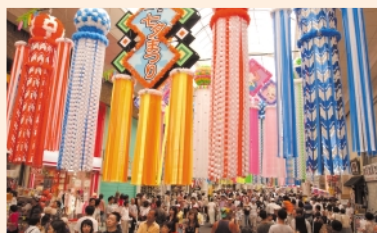
一宮七夕まつり(一宮市)

西尾張ブロックでは、福祉、協働、まちづくり、歴史・文化、観光振興の分野で5つの分科会が開催されます。