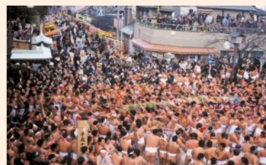
天下の奇祭「はだか祭」(稲沢市)

国営木曾三川公園のランドマークであるこのタワーは、高さ138メートルで展望室からは木曾川の雄大な流れや、日本アルプスの峰々、そして伊勢湾も一望できます。