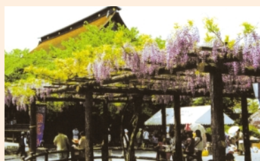
曼陀羅寺公園(江南市)

旧暦正月13日、国府宮一帯は祭の興奮に包まれます。参道では神男に触れて厄を落とそうと数千人のはだか男がもみ合います。