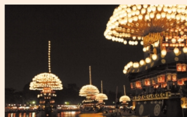
尾張津島天王祭(津島市)

全国に4つしかない国宝指定の城の一つで、日本最古の天守閣をもつ犬山城。木曾川の流れを背に小高い丘の上に建つ勇壮な姿が美しく別名「白帝城」とも呼ばれています。