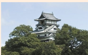
国宝犬山城(犬山市)

曼陀羅寺境内にある約10,000㎡の公園には、12種類約60本の藤が植えられており、公園内で咲き乱れる藤の花は見事で、「曼陀羅寺の藤」として大変有名です。