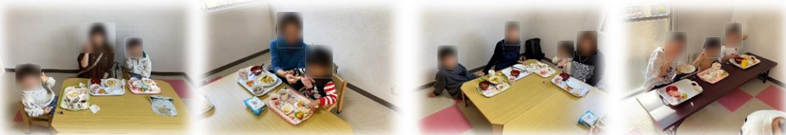
参加者のみなさん▷

HANDSの活動には沢山の方が関わっていて、NPOを始め、企業、社会福祉協議会、行政機関など様々な形で協働しています。他にもボランティアとして野菜を届けてくれる方や調理をしてくれる方、交流を促進してくれる方などがいて、高齢の方や子育て中の方など幅広い年齢の方が参加しています。