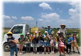
▲青空の下、みんなで とうもろこしを持って◎ (農業体験)