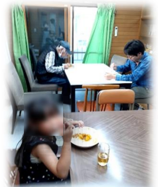
◁△みんなで食べると もっと美味しいね